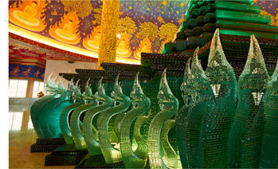
นาคน้ำแข็งที่วัดปากน้ำ มีลักษณะพิเศษทั้งอ่อนไหวและแข็งแกร่ง มีดวงตาที่สุกสกาว มีเครา เขี้ยวคม

"สาเหตุที่ทำพญานาค เป็นเพราะว่าเรือนร่างของพญานาคมีความพลัวไหว สื่อถึงความเป็นไทยได้ชัดเจน นอกจากนี้เรื่องราวของพญานาคเป็นที่เชื่อถือของคนในแถบเอเชีย สื่อถึงคนที่รู้จักได้ง่าย บังเอิญมาเกี่ยวข้องกับความผูกพันทางพุทธศาสนา เกี่ยวกับศิลปะ งานส่วนใหญ่ที่ผมทำเป็นโมเดิร์น คนจะคิดว่าฝรั่งทำ พอบอกว่าคนไทยทำก็คิดว่าไปก๊อปปี งานชิ้นนี้จึงเหมือนกับการประมุขชาติ ให้รู้ว่านี่คนไทยทำแน่ๆ