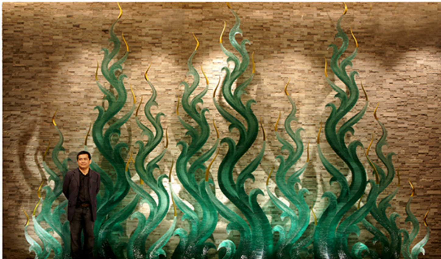
นาคน้ำแข็ง ที่โรงแรมเวสทิน ภูเก็ต ความ 4.8 เมตร กว้าง 5.5 เมตร แกะสลักจากแก้วซ้อนเรียงกันกว่า 7,000 ชิ้น

"สาเหตุที่ทำพญานาค เป็นเพราะว่าเรือนร่างของพญานาคมีความพลัวไหว สื่อถึงความเป็นไทยได้ชัดเจน นอกจากนี้เรื่องราวของพญานาคเป็นที่เชื่อถือของคนในแถบเอเชีย สื่อถึงคนที่รู้จักได้ง่าย บังเอิญมาเกี่ยวข้องกับความผูกพันทางพุทธศาสนา เกี่ยวกับศิลปะ งานส่วนใหญ่ที่ผมทำเป็นโมเดิร์น คนจะคิดว่าฝรั่งทำ พอบอกว่าคนไทยทำก็คิดว่าไปก๊อปปี งานชิ้นนี้จึงเหมือนกับการประมุขชาติ ให้รู้ว่านี่คนไทยทำแน่ๆ