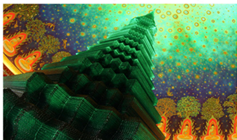
เจดีย์แก้ว แกะสลักจากแก้วกว่า 800 ชิ้น วางทับซ้อนกันทีละชั้น 800 ชั้น สูง 8 เมตร น้ำหนัก 18 ตัน

เรื่อง : ปิ่นอนงค์ ปานชื่น ภาพ : Jirawatn Chavanalit Art Glass Studio