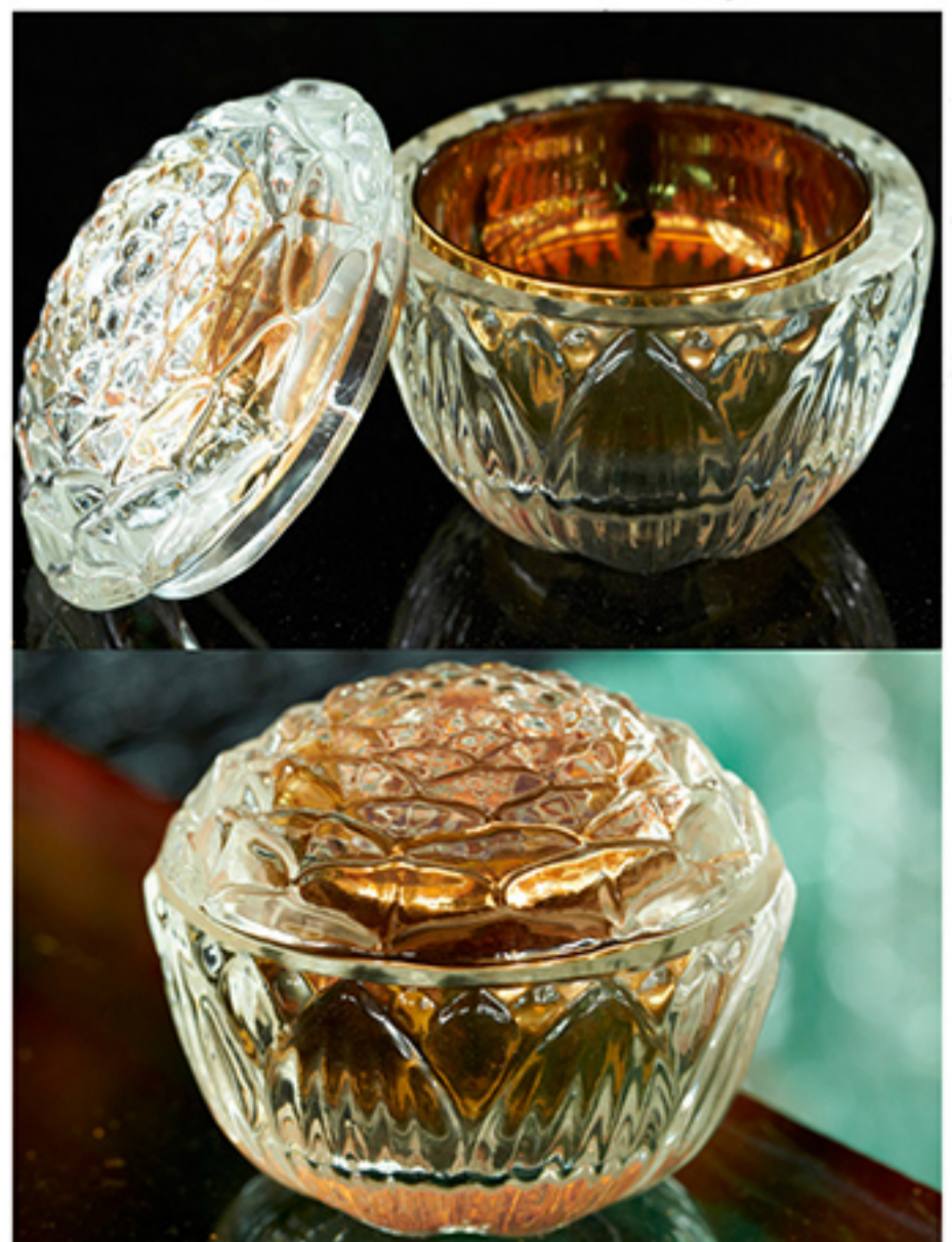
ดอกแก้วตัดตบงกช เทคนิคหลอมแก้วภายในกรวดด้วยทองคำบริสุทธิ์ สำหรับบรรจุพระบรมสารีริกธาตุในส่วนปลียอดสูงสุดของเจดีย์แก้ว

Ice Naga หรือ นาคน้ำแข็ง จึงถือกำเนิดขึ้นมาจากแนวความคิดที่เริ่มต้นจากแรงบันดาลใจจากความพลัวไหวของลายกนก ต่อมามีการนำความเข้มแข็งของสิ่งๆเข้าไปผสมผสาน สลัดนาคน้ำแข็งมีเส้นที่อ่อนไหวราวกับรวงข้าว ซึ่งเป็นผลงานที่ศิลปินกล่าวว่า " เป็นผลงานที่ดีที่สุดของผม "